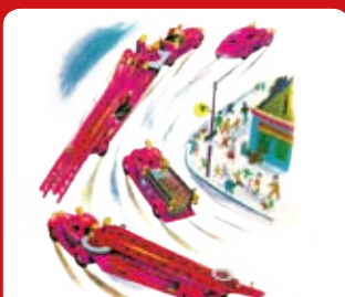
De brandweer wordt gealarmeerd