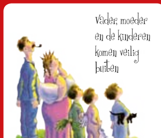
Vader, moeder en de kinderen komen veilig buiten