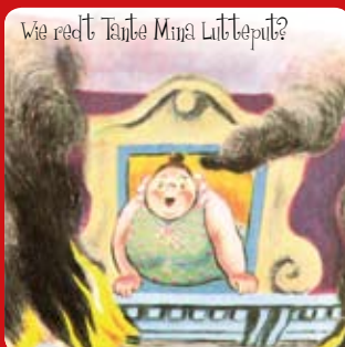
Wie redt Tante Mina Luitbeput?

Brand bij de buren, het zal mij'n zorg zijn!